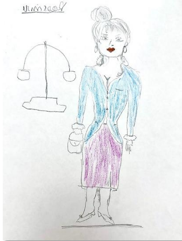
Figura 2 – Desenho-estória-temático (DET) da Rose. Título: A imagem de uma prostituta