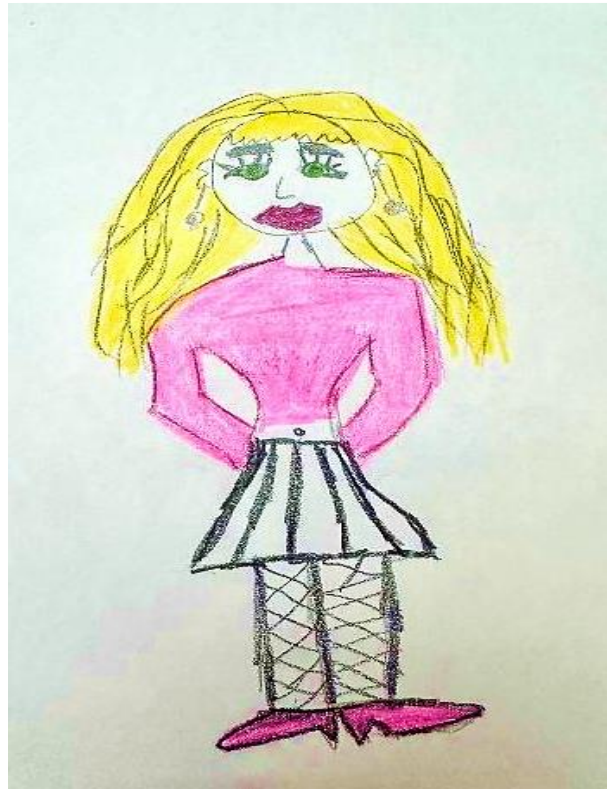
Figura 1 – Desenho-estória-temático (DET) da Bianca. Título: Era uma vez

Fonte: elaborado pela participante Bianca, fotografado pela autora (2024).