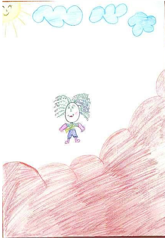
Figura 3 – Desenho-estória-temático (DET) da Mirela. Título: A história de Geninha