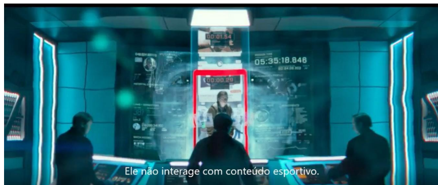
Figura 2 – Sala dos algoritmos com os três algoritmos e o avatar de Ben à frente (O dilema das redes, Netflix, 2020).

frequentemente usa as redes sociais digitais) para que ele fique mais tempo no celular, muitas vezes Ben volta a sua atenção ao aparelho, como na cena em que ele conversa com seu amigo sobre Rebecca. A cena do diálogo é intercalada com a da sala dos A.I.s: os algoritmos (encenados por atores) conversam entre si, dizendo que está na hora do intervalo da aula de Ben e resolvem enviar uma notificação sobre Rebecca, já que a localização deles está próxima. Ben interrompe a conversa para ver a notificação do celular. Aqui, o filme tenta estabelecer para o espectador uma sensação de êxito da tecnologia. Outro reforço desse ponto de vista são as orientações da irmã mais velha de Ben, Cassandra, que sempre o alerta sobre o mal do celular.