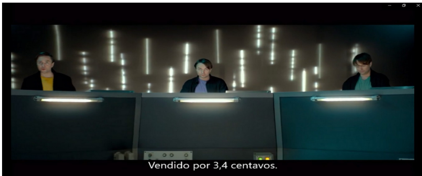
Figura 1 – Representantes dos objetivos das empresas de tecnologias, e os algoritmos de Bem (O dilema das redes, Netflix, 2020).

Em sua análise do desenvolvimento da produção de docudrama, Mercadé, Puig e Álvarez (2012) apontam que houve um distanciamento de elementos documentais e mais aproximação com os elementos ficcionais: o gênero foi sofrendo maior dramatização, especialmente desde os anos 1980, com a influência marcante das obras norte-americanas. Vale ressaltar que, como houve uma prevalência televisiva dos docudramas, a maioria dos autores aqui citados voltaram seus estudos para obras feitas para o formato da televisão – à exceção de Lipking, que analisa filmes cinematográficos em longa-metragem.