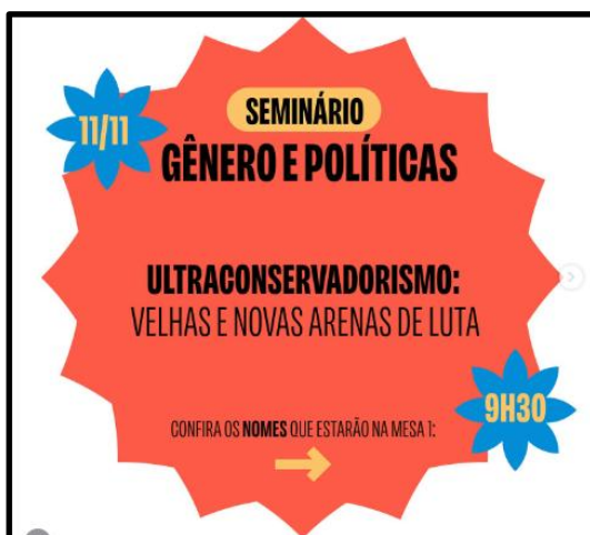
Figura 7 – Post G02 Geledés (2024): “Seminário Gênero e Políticas: ultraconservadorismo” - ONU + raça-gênero global

Fonte: Captura de tela do Instagram (2024).