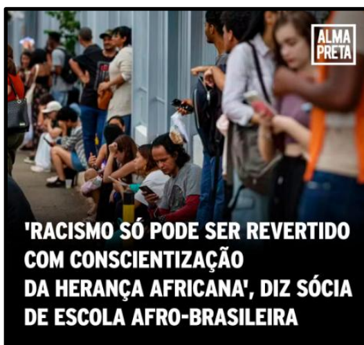
Figura 14 – Post A21 Alma Preta (2024): Escolas periféricas contra o eurocentrismo epistêmico