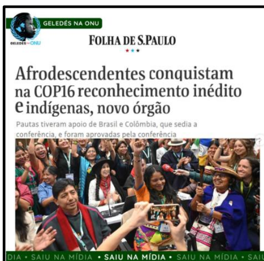
Figura 10 – Post G04 Geledés (2024): Norma eurocêntrica confrontada na COP16