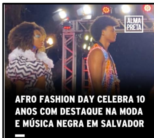
Figura 12 – Post A09 Alma Preta (2024 - Afro fashion Day celebra 10 anos com destaque na moda e música negra em Salvador