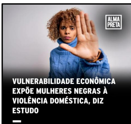
Figura 16 – Post A19 Alma Preta (2024): Vulnerabilidade econômica + violência doméstica