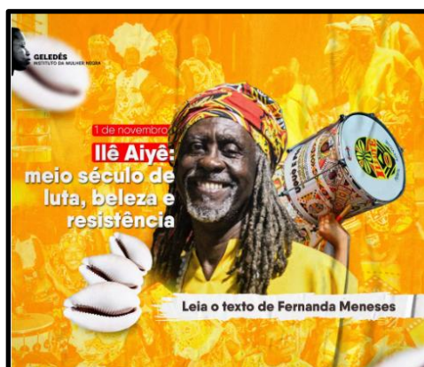
Figura 5 – Post G01 Geledés (2024): Ilê Aiyê na COP16 como resistência institucionalizada