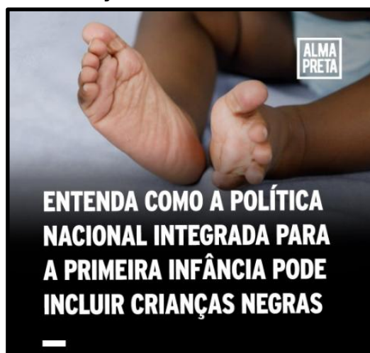
Figura 9 – Post A22 Alma Preta (2024): “Primeira infância negra - raça+classe+infância”

Fonte: Captura de tela do Instagram (2024).