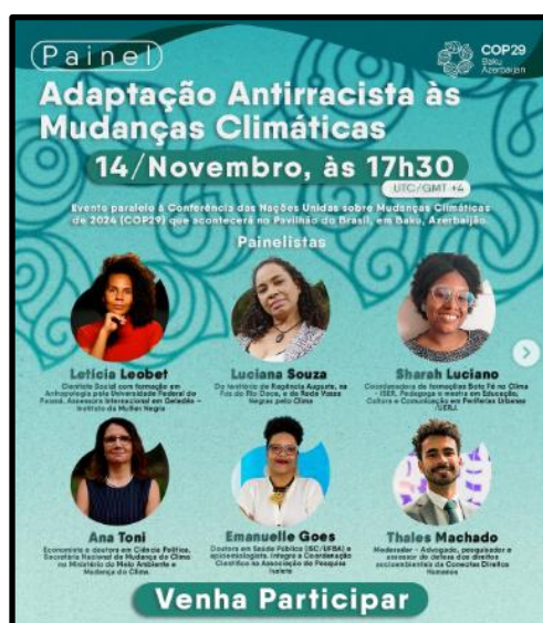
Figura 15 – Post G15 Geledés (2024): G20 + afrodescendente + interseccionalidade - cruzamentos institucionais