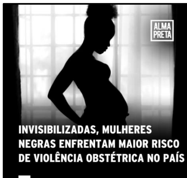
Figura 8 – Post A95 Alma Preta (2024): Violência obstétrica e interseccionalidade - interseções periféricas concretas