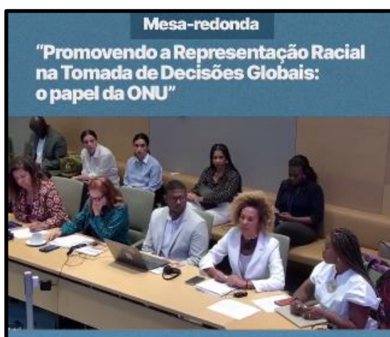
Figura 3 – Post G07 Geledés (2024): Mesa-redonda: promovendo a representação racial na tomada de decisões globais: o papel da ONU