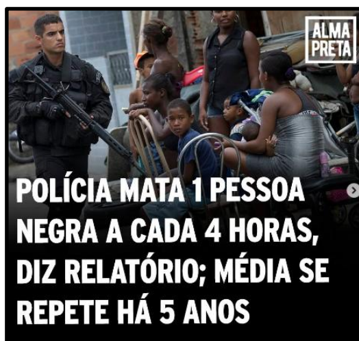
Figura 4 – Post A40 Alma Preta (2024): “1 negra morta a cada 4 horas” - letalidade policial viralizada (Mbembe, 2018)