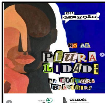
Figura 13 – Post G13 Geledés (2024): Podcast “Essa Geração” propõe pedagogia antirracista global