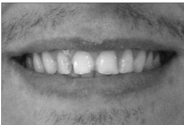
Figura 2. Antes da reconstrução das alturas das bordas incisais e linha do sorriso