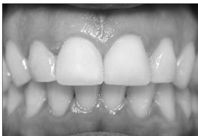
Figura 4. Após a reconstrução estética