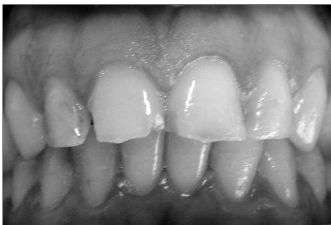
Figura 1. Antes da reconstrução estética