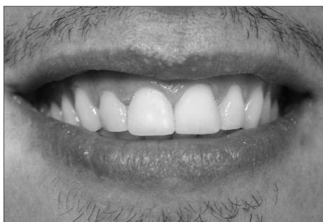
Figura 5. Após a reconstrução das alturas das bordas incisais e linha do sorriso